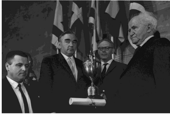
בן גוריון מעניק את הגביע לרב אמן קוטוב, ראש הנבחרת המנצחת ברית המועצות, באולימפיאדת תל אביב 1964. ביניהם מיכאל בוטביניק, משמאל ישראל אשל, מנהל האולימפיאדה