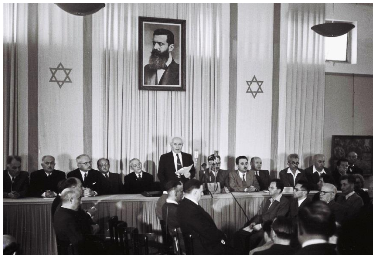
בן גוריון מכריז על הקמת מדינת ישראל

"אנו מכריזים בזאת על הקמת מדינה יהודית בארץ ישראל, היא מדינת ישראל"(!)